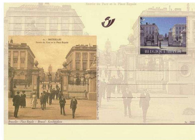
As van de macht, van de Warande over het koningsplein naar het justitiepaleis. Waar Godfried van Bouillon nu staat, stond het standbeeld van Karel van Lotharingen.

Wil men het tonen, dat kan om de twee jaar in het kader van Ke.The.Fil met de één blad wedstrijd.